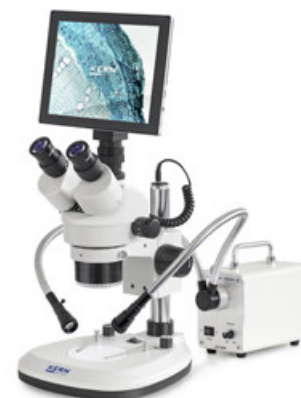
Esempio di applicazione