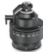
Condenseur « Swing-Out »