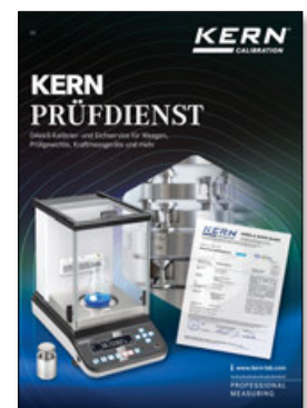
Brochure KERN Service d'étalonnage DAkkS