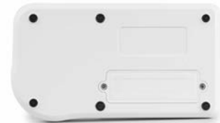
Vista posterior, tapa atornillada del compartimento de la pila