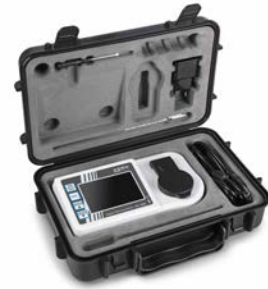
Maletín de transporte