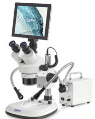
Ejemplo de aplicación