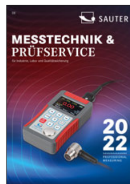
SAUTER Messtechnik Katalog