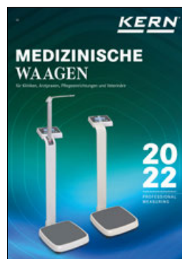
Medizinische Waagen Katalog