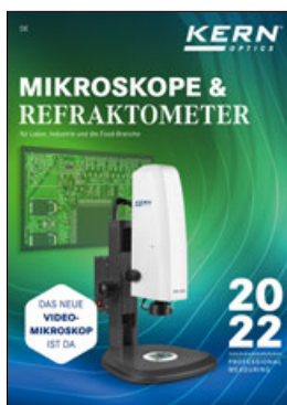
Mikroskope & Refraktometer Katalog