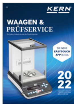
Waagen & Prüfservice Hauptkatalog