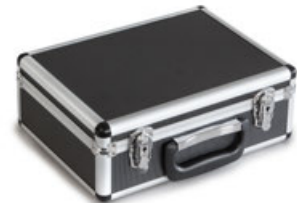
Transport- und Aufbewahrungskoffer ORA-A1102