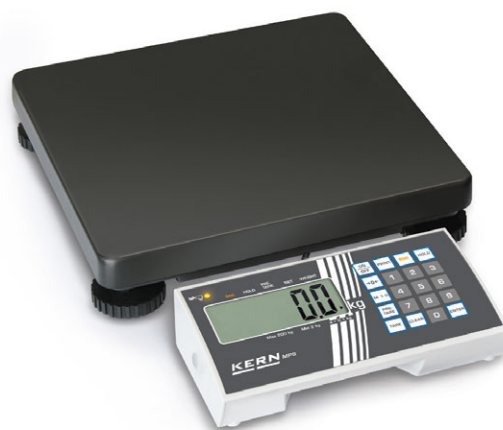
KERN MPS-M con indicador desocupado