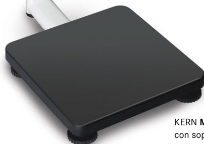
KERN MPS-PM con soporte