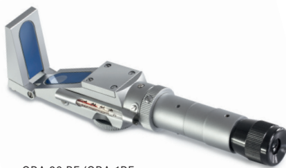
ORA 90 BE/ORA 1RE