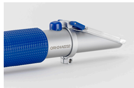
NUOVO: ora con numero di serie inciso