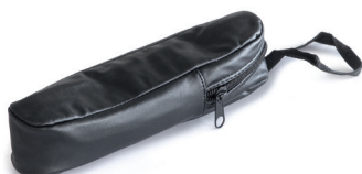
Custodia di fintapelle ORA-A2103