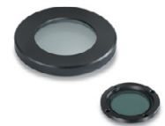
Unidad de polarización sencilla