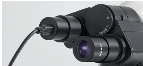
Cámara ocular sujeta al tubo