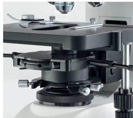
OBN-15 : Condenseur de contraste de phase monté