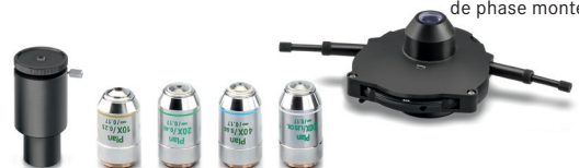
Condenseur rotatif universel PH 5× avec objectifs plan PH corrigé à l'infini 10×/20×/40×/100× (kit complet, Inclus avec OBN-15)