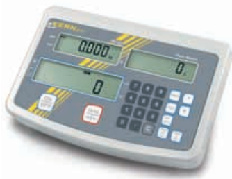
1 KERN KFS-T