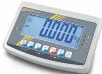
2 KERN KFB-TM