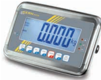
3 KERN KFN-TM