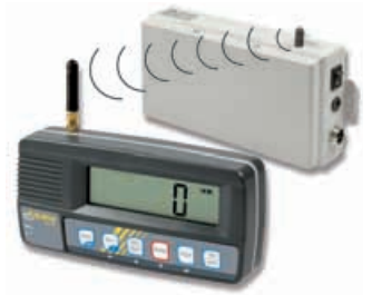
4 KERN KFF-T